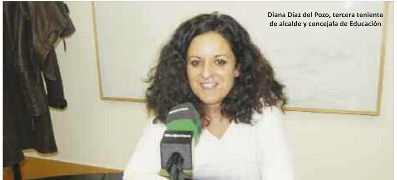
Diana Díaz del Pozo, tercera teniente de alcalde y concejala de Educación

Limpieza especial de los centros La limpieza y desinfección de los centros educativos es una de las medidas de seguridad más importantes frente al COVID-19, y por ello el Ayuntamiento de Alcalá de Henares está incorporando a un total de 31 personas como refuerzo de limpieza por las mañanas en todos los centros públicos de infantil y primaria de la ciudad. Reparto de mascarillas El Ayuntamiento comenzó el