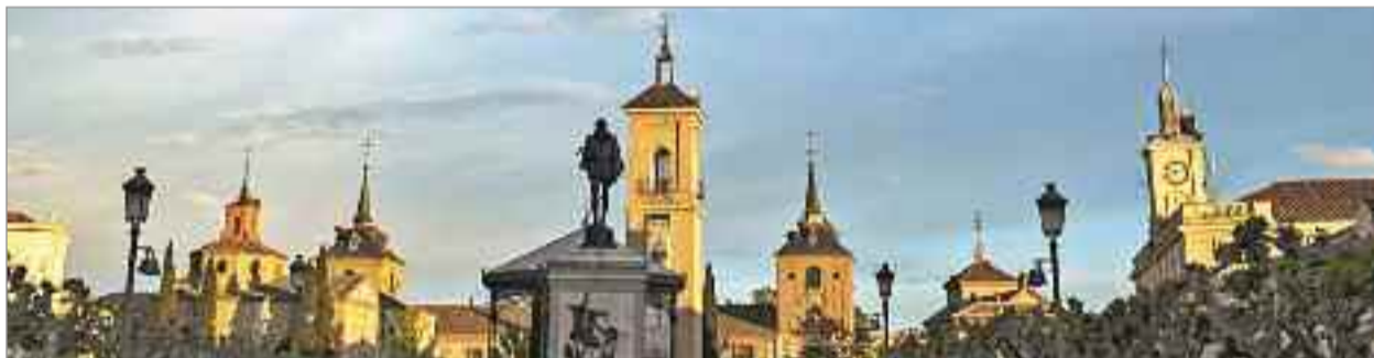
Las soluciones tecnológicas derivadas de la puesta en marcha del Plan generarán confianza en los turistas y beneficiarán también a los vecinos y vecinas de Alcalá de Henares

La puesta en marcha y finalización del Plan supondrán como consecuencia el aumento de la calidad y la cantidad de la oferta, la optimización de la comprensión del turista y la construcción de un destino más conocido y más seguro, y en consecuencia, más atractivo.